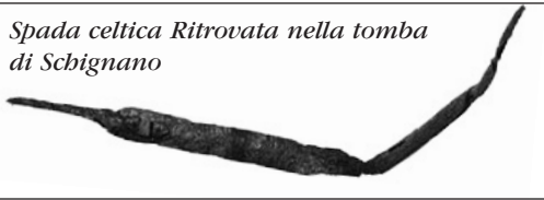
Spada celtica Ritrovata nella tomba di Schignano