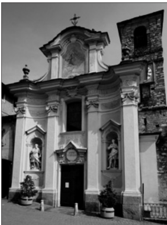
nella foto il prospetto di Santa Maria di Scaria