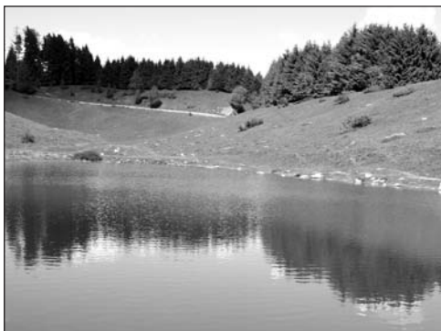
Pian delle Alpi