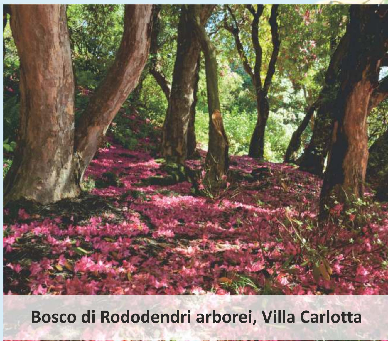
Bosco di Rododendri arborei, Villa Carlotta