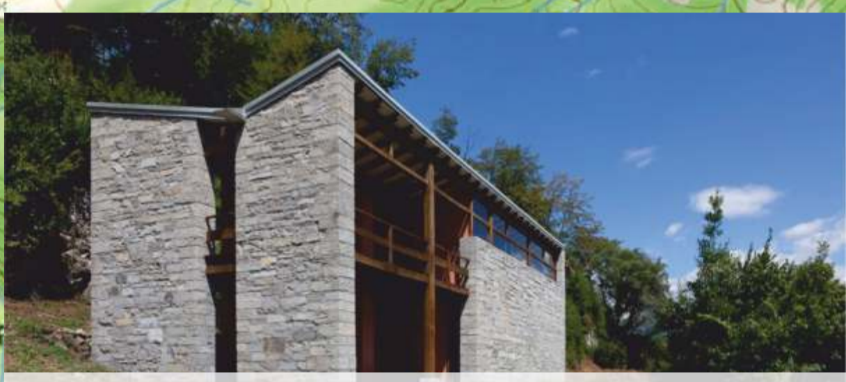
Case per artisti, Isola Comacina