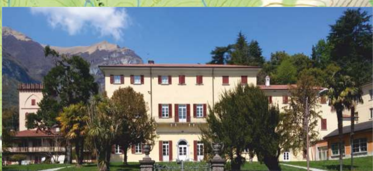
Villa Mainona, Tremezzina