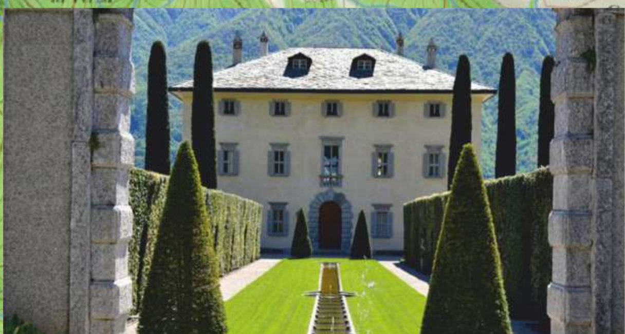
Villa Balbiano, Tremezzina

La Greenway è una piacevole passeggiata di circa 10 km da Colonno a Griante che a tratti segue l'Antica Via Regina; adatta a tutti, consente la scoperta di splendide ville e giardini, reperti di epoca romana, borghi antichi e incantevoli scorci naturali.