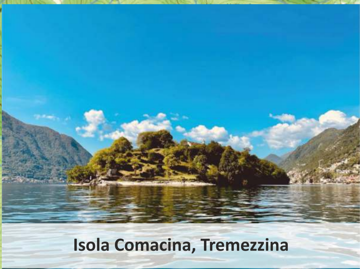
Isola Comacina, Tremezzina